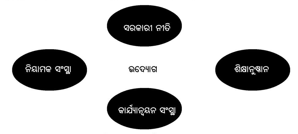
ଚିତ୍ର : ୧ : କୌଶଳ ବିକାଶ ପାଇଁ ଉଦ୍ୟୋଗଜଗତର କେନ୍ଦ୍ରୀୟ ଭୂମିକା ।

`C' ସଂପର୍କରେ ଅଭିଜ୍ଞ । ସେଗୁଡ଼ିକ ହେଉଛି Communication (ସଂଚାର), Collaboration (ସହଭାଗିତା), Creativity (ସୃଜନଶୀଳତା) ଏବଂ Critical Thinking (ବିଶ୍ଳେଷଣାତ୍ଲକ ଚିତ୍ତନ) । ତେଣୁ, କୌଶଳ ବିକାଶର ପ୍ରତ୍ୟେକ କାର୍ଯ୍ୟକ୍ରମ, ଏହି ବିଷୟଗୁଡ଼ିକ ଉପରେ ଧାନ ଦେବା ଆବଶ୍ୟକ। ଯଦ୍ୱାରା